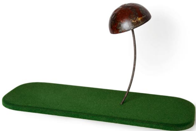
Einsamer Pilz 2010 44,5 x 80 x 30 cm C_099