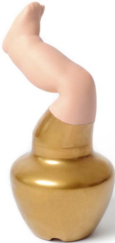
Golden Leg 2010 23 x 15 x 11 cm C_108