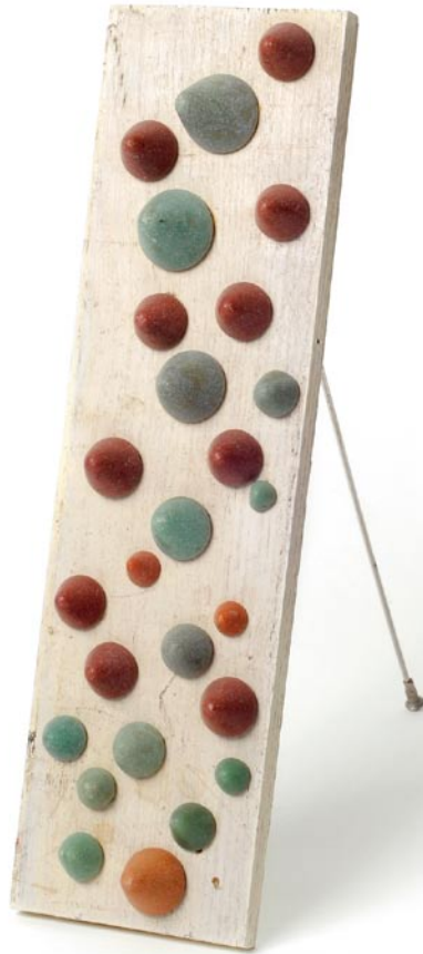
Kletterwand hinter den Siebenbergen 2010 25 x 7 x 24 cm C_105