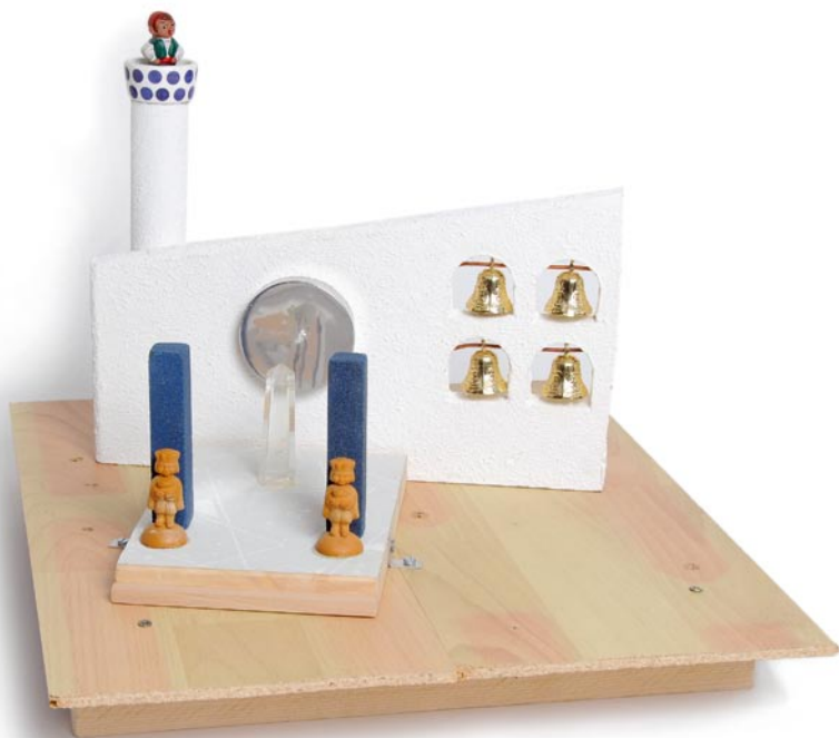
Tempelbezirk 2009 32 x 40 x 45 cm C_074