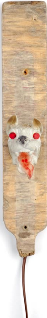
Märchenonkel 2006 45 x 8 x 15 cm C_028