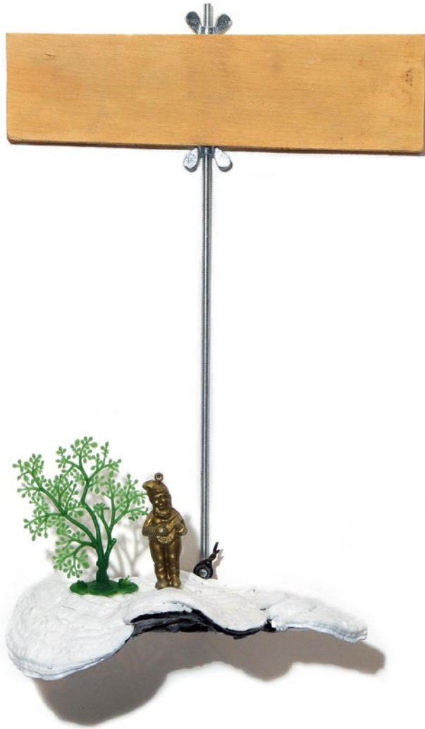
Just for art 2008 39 x 27 x 21 cm C_060